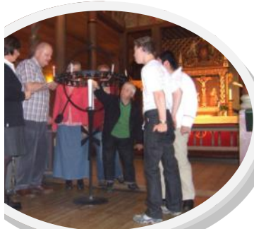
Tro og Lys-gruppen i Ål

Vi forsøker også å utdype vennskapet oss i mellom ved å møtes utenom de vanlige møtene: besøke hverandre, dra på turer sammen, delta på felles retretter og lignende.